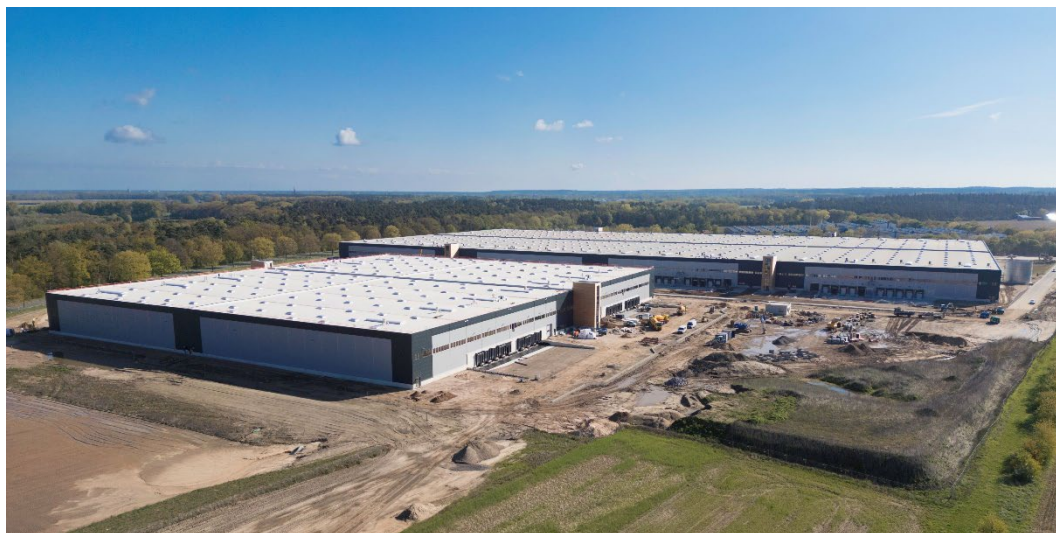
Baustelle Mittelweser Parks.