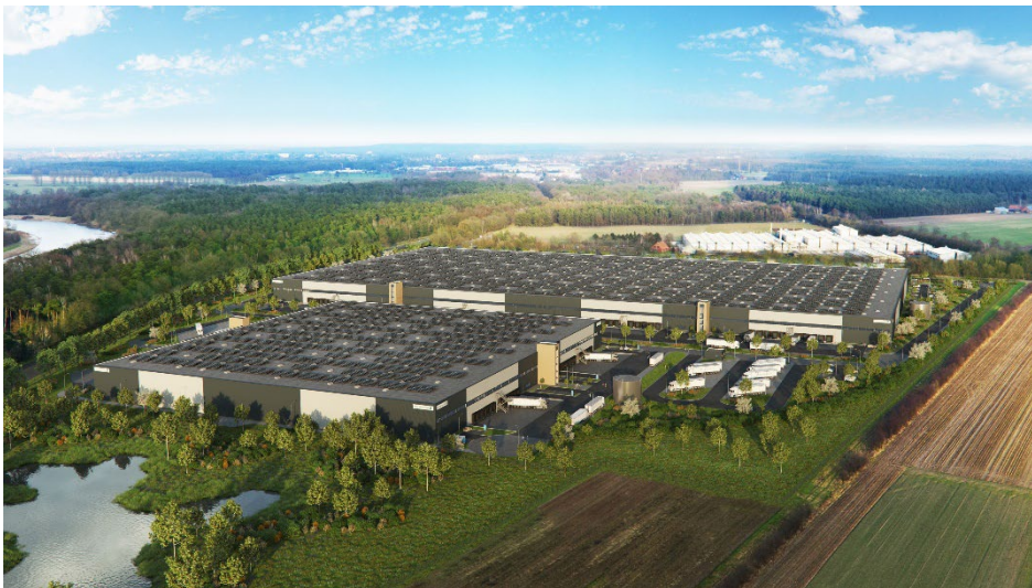
Visualisierung des Mittelweser Parks bei Fertigstellung.